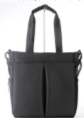
TMI-10006(トートバッグ) 32×35×10. 5 税込み¥11,000