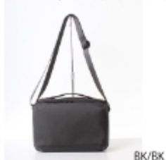
TMJ-6803(ミニショルダーバッグ)27. 5×19×7 税込み¥7,480