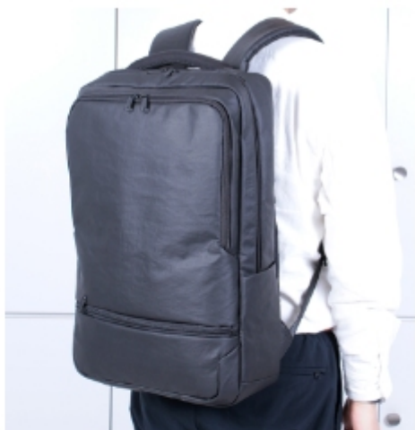
TMW-12900 ヲヅ -3WAY 素材:PU-テイヴ コーヂ ヲヅイヴ ヲヅイヴ 重量:920g容量:11L W40×H29×D9.5cm 税込み ¥14,190