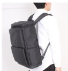
TMI-15500(3WAYバッグ) 43×27.5×13.5 税込み¥17,050