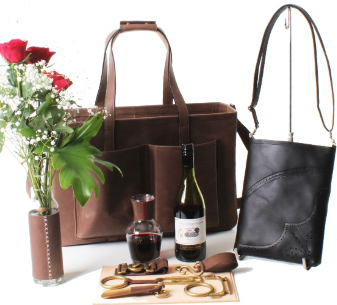
Table picnic COLLECTION